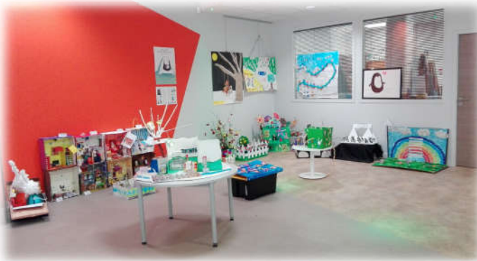
Exposition à la bibliothèque de Fontaine d'Ouche.